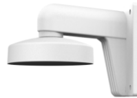
DS-1273ZJ-135 Настенный кронштейн