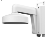
DS-1273ZJ-135B Настенный кронштейн с монтажной коробкой