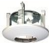
DS-1227ZJ Внутрипотолочное крепление